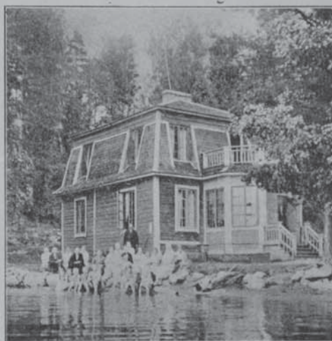
Kesäsiirtolan asuinrakennus Enon saarella.