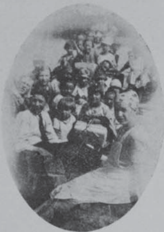
Nämäkin pojat ja tytöt halusivat päästä Enon saareen.

työläiset tukevat yritystä. Järjestönnekin voisi keskustella siirtolan tukemisesta sekä myöntää tarkoitukseen varoja mahdollisuuksien mukaan. Myöskin otamme kiitollisuudella vastaan muunlaistakin avustusta, kuten urheiluvälineitä, makuuvaatteita, taloustavaroita y.m., jotka kuitenkin kehoitamme teitä hankkimaan meiltä saatavien ohjeiden mukaan, että hankinnoissa olisi yhdenmukaisuutta.